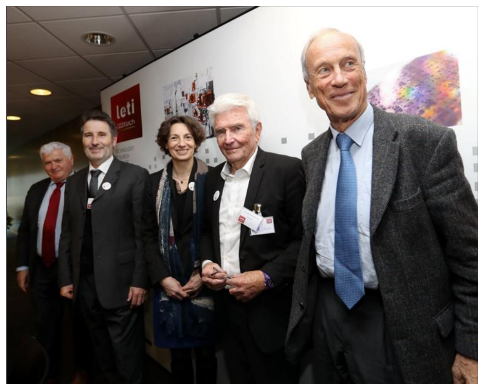
Aujourd'hui, le CEA-Leti n'a pas perdu sa raison d'être et continue ses recherches dans plusieurs domaines innovants.

Grâce à cette nouvelle structure, il s'est rapproché des recherches fondamentales, des universités et des industriels, et s'est imposé en pionnier mondial des micro et nanotechnologies.