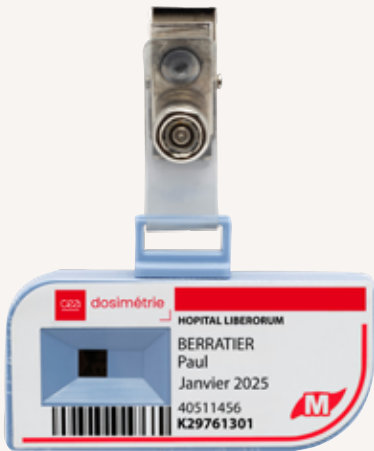
Dosimètre RPL réutilisable